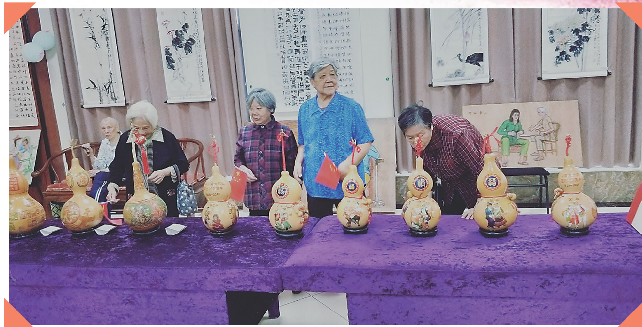
重阳节,盛康·国际颐养苑老人们举办艺术欣赏活动。

老有所养,是盛国文十年来在心头绘制的画卷,如今,梦想之光,已经照进现实,惠及无数老年人。