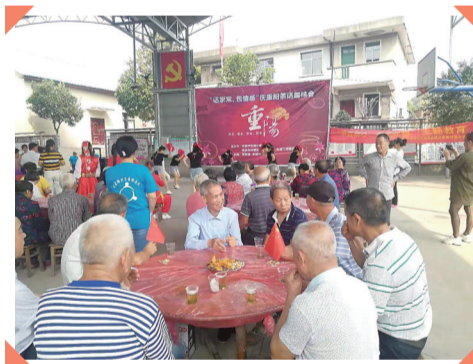
重阳节,宋家桥村举办“话家常·包情感”活动。