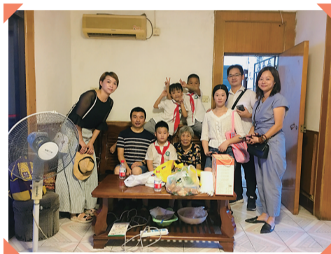
重阳节前夕,荷塘小学师生来到桂花街道新荷社区居委会参加敬老敬老活动。

老有所为,老有所为。老龄人口的健康幸福成为社会最大的新愿,我们可以如“盛国文”们一样,投身养老事业,想办法为社会做出过贡献的老人们安享时光;当你老了,没有时光逝去的忧伤,可以如“谭敬炎”们一般,用自己的各种特长发挥余热,让日子快乐而充满阳光。