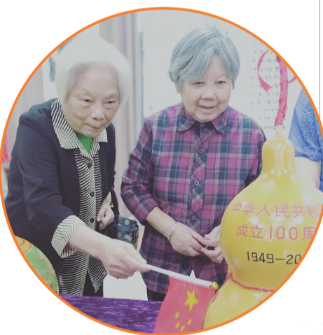
在盛康·国际颐养苑,老人们沉浸在国庆的快乐气氛中。