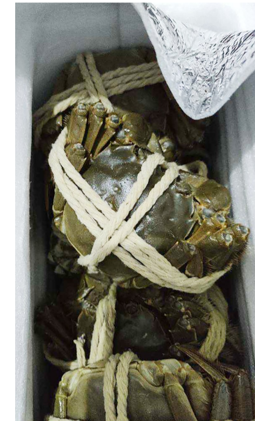
▲一箱螃蟹全死了

最后,记者将情况反馈给天猫商城的“店小二”维权中心,经过协调,天猫商城最终将螃蟹款全额退给邱先生。