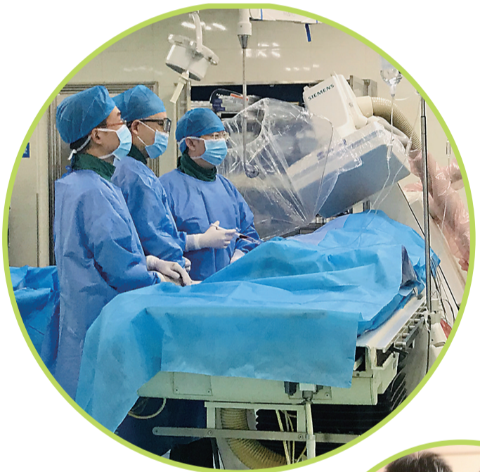
“生物可吸收冠脉支架”植入手术现场图。