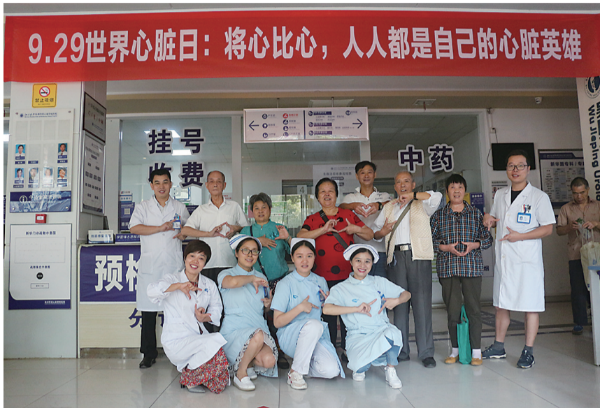
今年世界心脏日医生与市民合影。

“善学者尽其理,善行者究其难”。株洲恺德心血管病医院争当善学者,不断加强心血管外科与心血管内科两大专科建设,不负生命重托;争当善行者,按照国家标准发展胸痛中心、房颤中心、心衰中心,守护“心”健康,愿为祖国健康事业增添“心”动力。