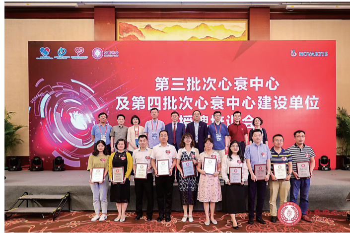
该院成为中国心衰中心建设单位授牌现场。

时光易逝,故事常新。株洲恺德心血管病医院正“躬逢盛事”与“有荣焉”,在改革创新的大道上,以心血管学科建设为发展之本,以病人为中心为服务理念,求新思变、敢闯敢拼、谋百姓健康之业、扬医疗改革之帆,朝着满足大众日益增长的健康需求奔腾向前,为守护祖国“心”事业贡献自己的力量,为健康中国添“心”动力,行稳致远,矢志向前。