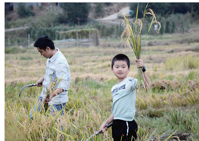
昨天上午,市妇联“稻花香”读书会组织孩子们到白关书画院罗老师的农田里,让孩子们下田挥镰收割稻米,体验一下农民伯伯的辛苦。 投稿:广东