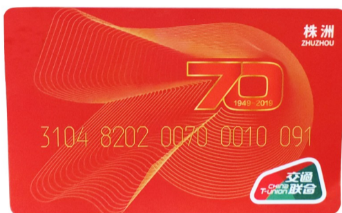
▲交通一卡通纪念卡(正面)