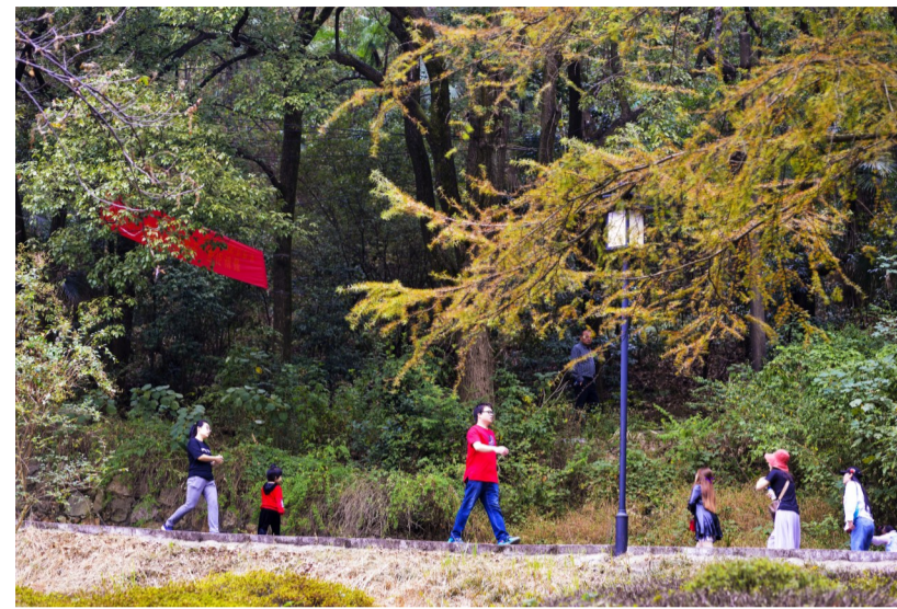
▲10月6日,石峰公园,行道树的叶子逐渐变黄,秋意渐浓