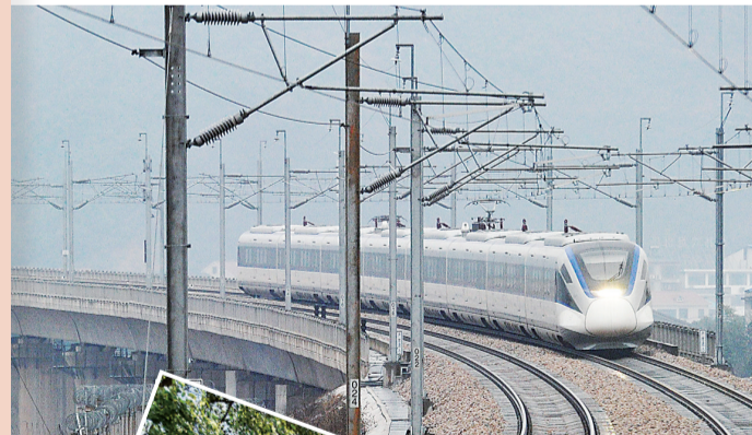
2016年12月,长株潭城际铁路正式开通运营。