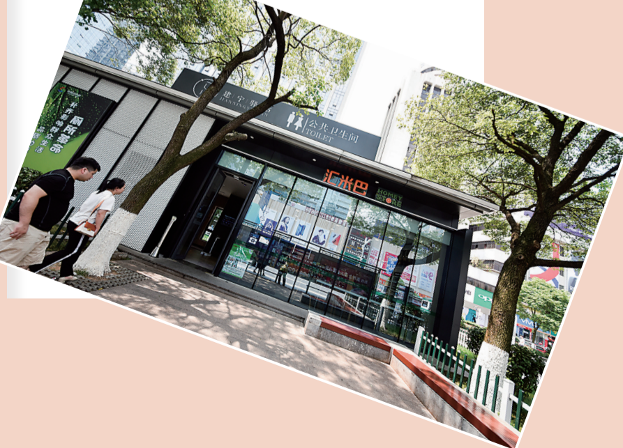
2018年11月,首座“建宁驿站”投入使用。至2019年7月26日,株洲市城区开工新建“建宁驿站”161座、建成并投入使用99座。