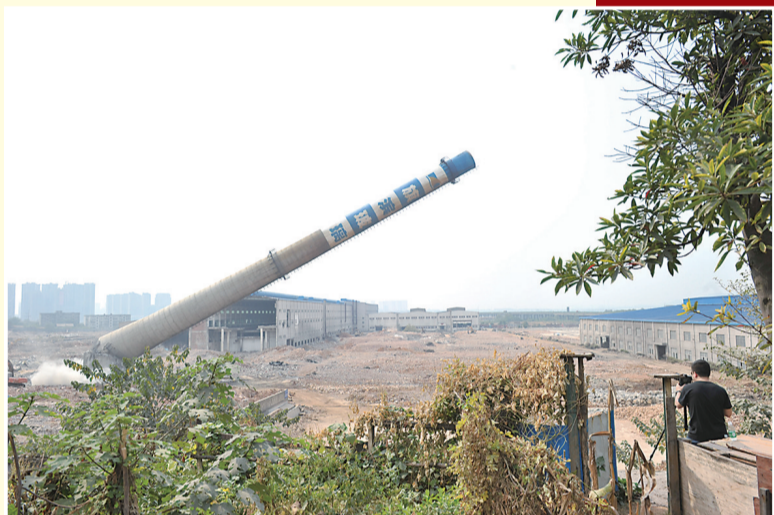
2014年10月27日,旗滨集团株洲基地的烟囱全部顺利拆除,清水塘老工业区搬迁改造正式拉开大幕。