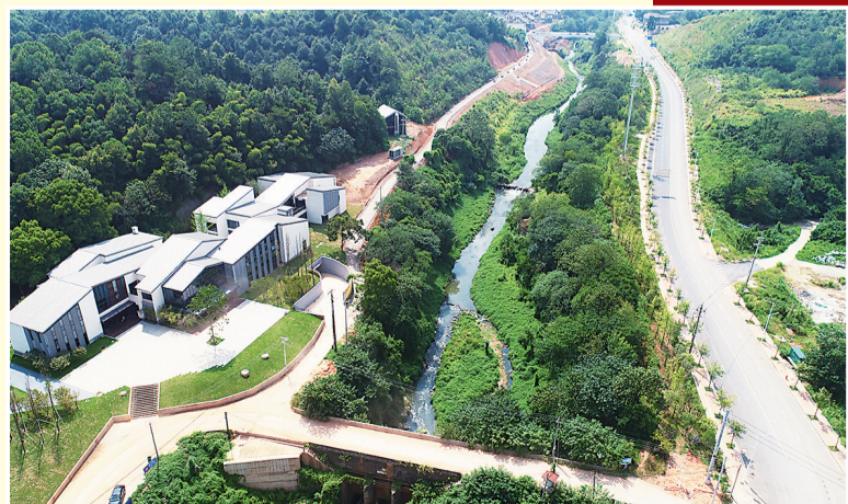
2019年4月,《株洲市城市黑臭水体治理攻坚实施方案》印发,明确到2020年底城市建成区黑臭水体消除比例达到90%以上。目前,翠塘、天鹅湖、西湖、枫溪港、凿石港、陈埠港先后完成黑臭水体整治。