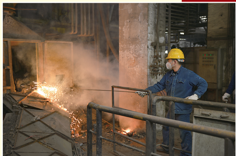
2018年12月30日,株洲冶炼集团在清水塘片区最后一座运行中的冶炼炉熄火关停。至此,清水塘老工业区261家企业全面关停。