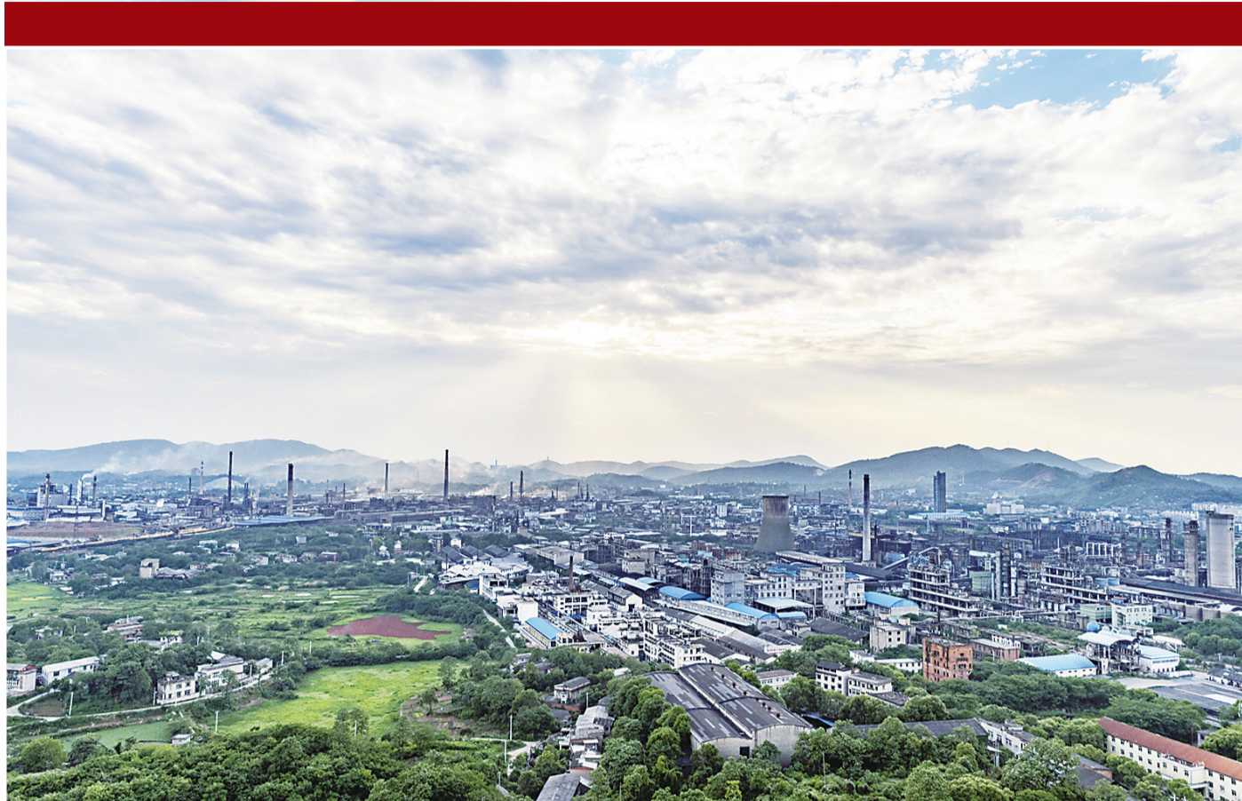
2013年1月1日,株洲市开始实施最新的环境空气质量评价标准,衡量环境空气质量好坏的3项指标增至6项,并向社会正式发布空气质量指数数据。图为清水塘老工业区鸟瞰图。