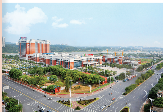
2013年3月,全市投资最大的卫生基建项目——市中心医院全面竣工并整体搬迁。