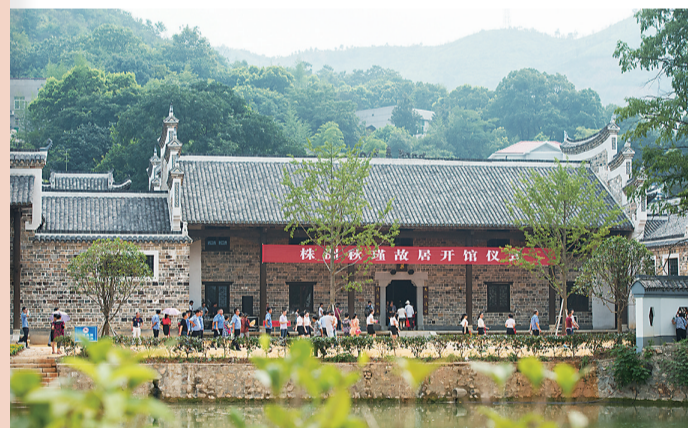
2016年7月,秋瑾故居开馆。