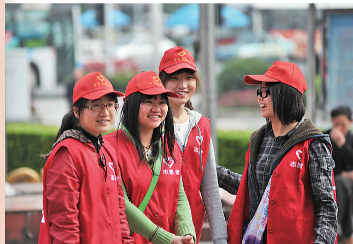
2015年2月28日,我市荣获全国文明城市称号,同时荣获全国未成年人思想道德建设工作先进城市称号。