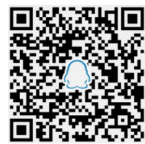
▲晚报乐活周刊QQ读者群

特别提醒:本刊登载的文章、美术作品均有稿酬(纸质版、电子版、微信版稿酬合一),凡未收到稿酬的作者,请与本刊编辑部联系。作者如无特殊声明,即视为同意授予本刊及本刊微信版、本刊合作网站信息网络传播权,本刊支付的稿酬包括此项授权的收入。