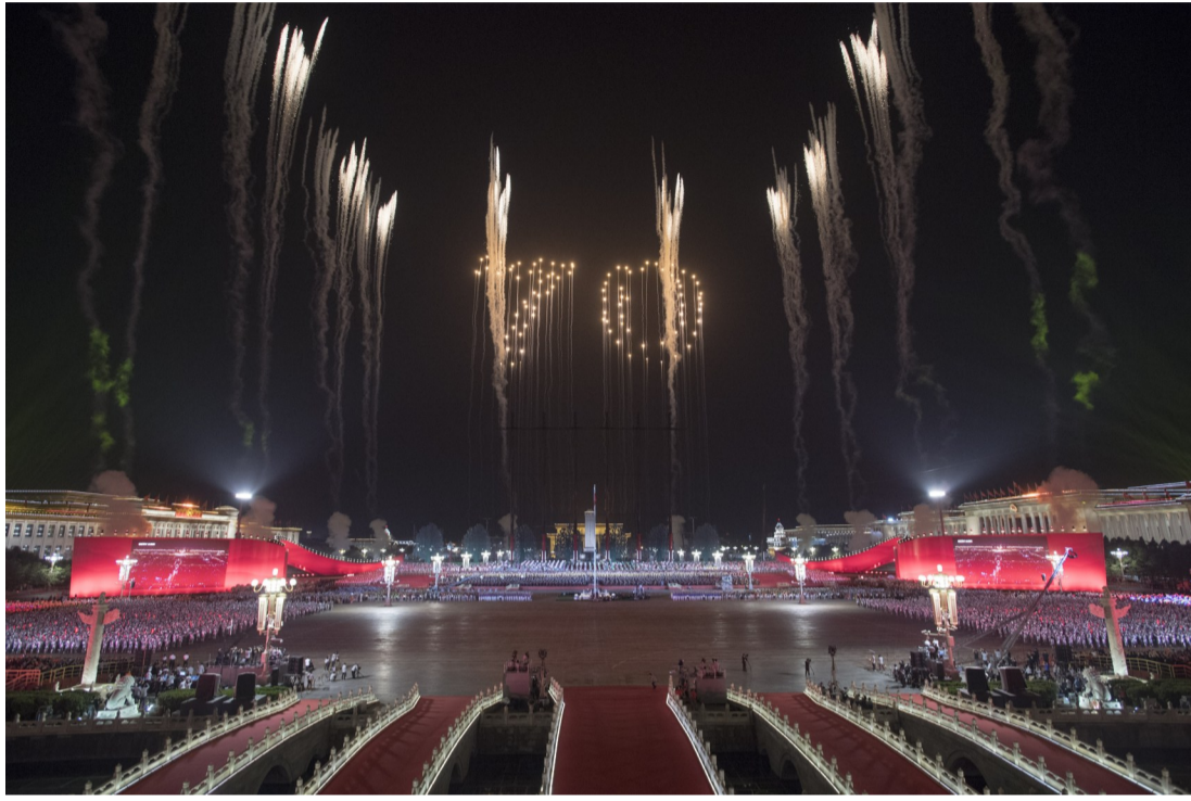
▲联欢活动上,醴陵产的高难度特效焰火“70”

10月1日晚,在天安门广场举行的庆祝中华人民共和国成立70周年联欢活动上,一场绚烂夺目的焰火表演惊艳了世人的眼球。而其中,由烟花拼成的“70”和“人民万岁”字样,是由醴陵市神马烟花制造有限公司“书写”。