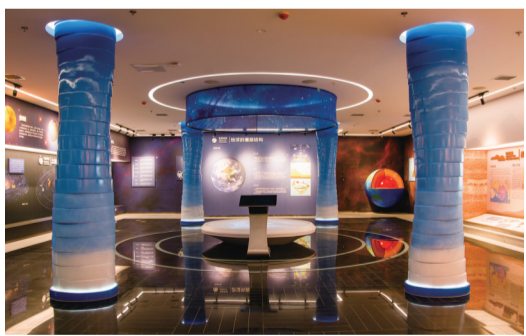
▲酒埠江地质博物馆内景

与此同时,酒仙湖景区还推出星空帐篷节、叠千纸鹤写祝福语、“新中国在我心中”朗诵、“庆国庆 爱家乡”主题系列网络文化等活动,欢迎来自四方游客前来体验。