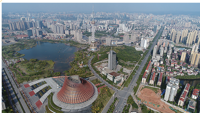
美丽株洲。