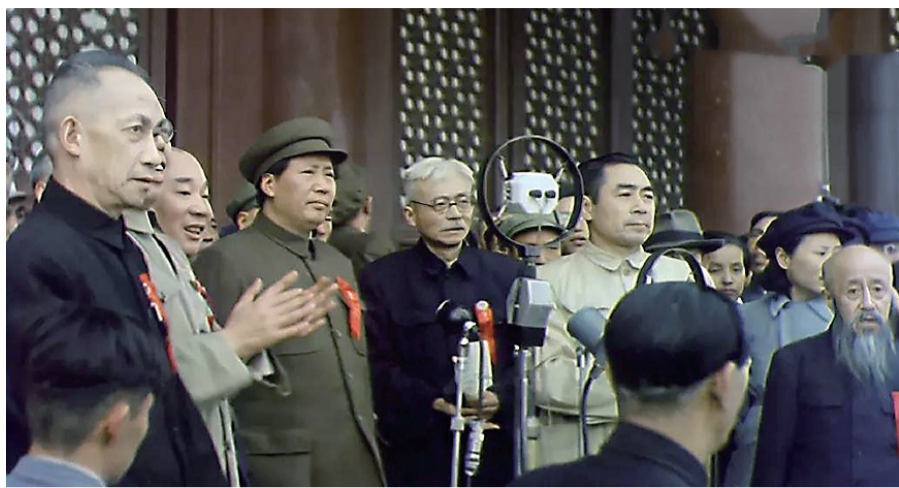
图为修复后的开国大典画面

1949年10月1日,庆祝中华人民共和国中央人民政府成立典礼在天安门广场隆重举行。三十万军民参加这一旷世盛典。近日,中央档案馆公布了一批精选馆藏珍贵档案文献,其中12分钟珍藏版开国大典彩色影像首次公开。该影像档案以俄罗斯联邦档案部门提供的开国大典彩色影片为基础剪辑制作,是目前公开的关于开国大典时间最长、内容最完整的视频,真实还原了这一伟大的历史时刻。请用手机微信“扫一扫”功能扫码观看视频。