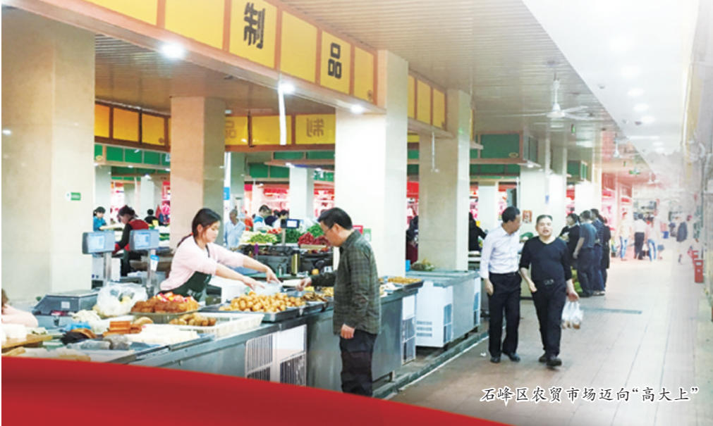
石峰区农贸市场迈向“高大上”

告别污水横流,没有出台经营,活禽宰杀被“请”进敞亮的玻璃房……走进新天桥农贸市场,让人眼前一亮:交易大厅整洁明亮,LED显示屏实时显示当天食品安全检测信息,过磅彻底清洁,功能分区清晰,监控、农产品快速检测室等配套设施完善,“高大上”的环境让人眼前焕然一新,对农贸市场的印象。前来买菜的老百姓交口称赞:“现在进菜市场买菜就像逛超市一样,买得舒心,回家吃得放心。”