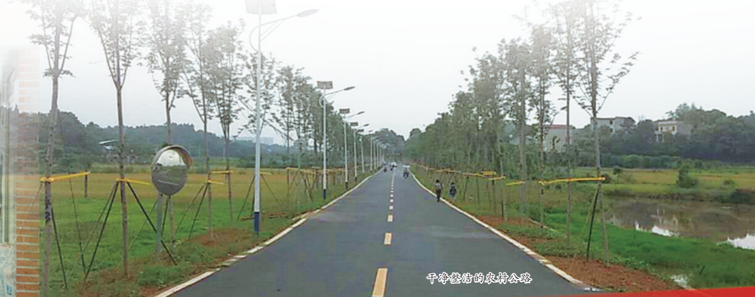
中车株洲的农场公园