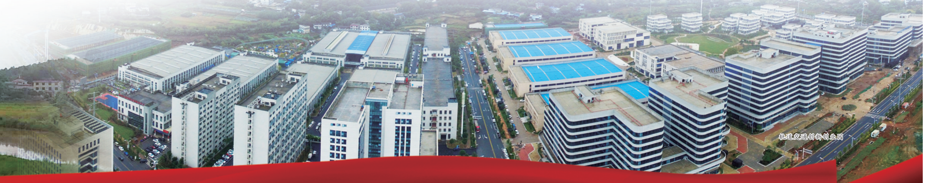
小区改造前的旧貌