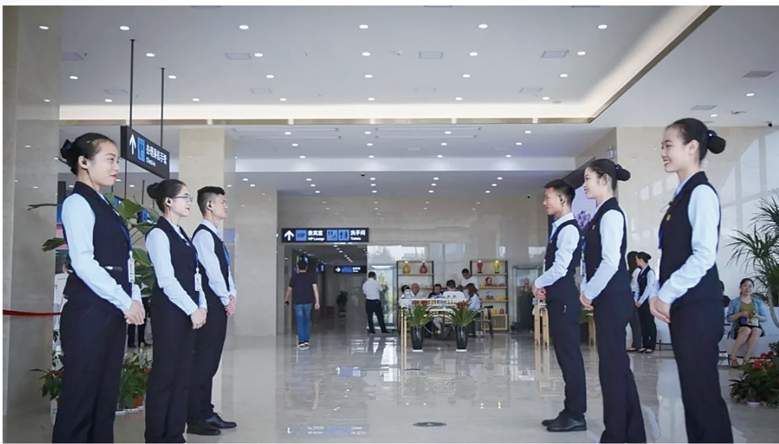
黄花国际机场株洲城市候机楼启用