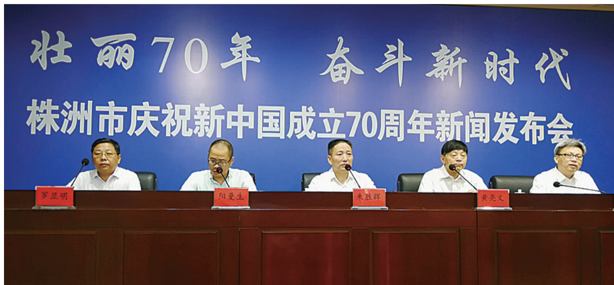
▲新闻发布会现场

日前,为期三个月的“壮丽70年·奋斗新时代”株洲庆祝新中国成立70周年系列新闻发布会落下帷幕。70年株洲的历史巨变、新时代株洲人民的奋进足音、老百姓的幸福生活,在系列新闻发布会中娓娓道来,引发强烈反响。