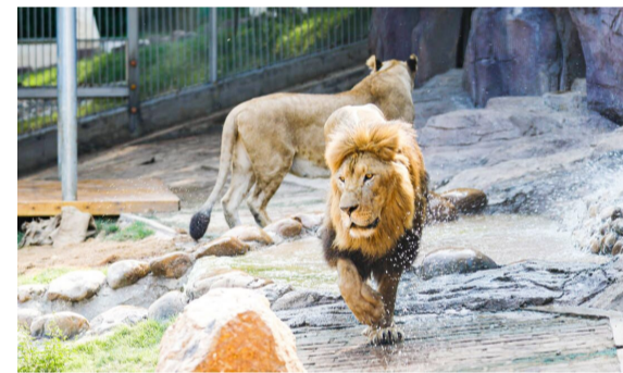
▲非洲狮子

本报讯(记者 伍靖雯 通讯员 翁艳恒)昨日,记者从株洲市园林绿化中心获悉,位于石峰公园的石峰动物园改造工程已基本完工,10月1日将正式开园迎客。