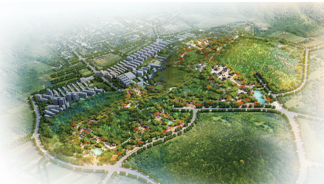
▲凤凰山鸟瞰效果图

“山体一侧有老产业区、学校、生活区,而另一侧的新产业区、学校,以及新住宅区也正在布局。”相关工程人员介绍,2017年,国家“十三五”规划的头号工程“两机”专项——中国航发株洲航空动力产业园在株洲航空城正式开工,产业园正位于凤凰山脚下,未来,这里将成为国内领先、国际一流的中小航空发动机产业基地。还有即将建成的南方中学新校区,也与凤凰山公园近在咫尺。因此,可将凤凰山公园打造成全市工业旅游、研学教育、产城融合建设的新地标。