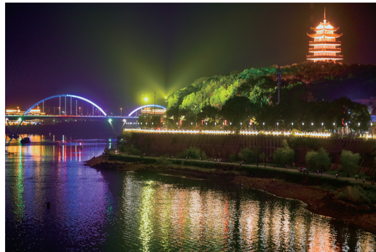
▲国庆期间,“一江两岸”夜景亮化三期提质,美轮美奂

本报讯(记者 伍靖雯 通讯员 廖雨燕)记者昨从市城管局获悉,我市“一江两岸”亮化提质项目已基本完工。国庆节当天开始,每天晚上7点起,全新的夜景“灯光秀”将点亮株洲,向新中国成立70周年献礼。