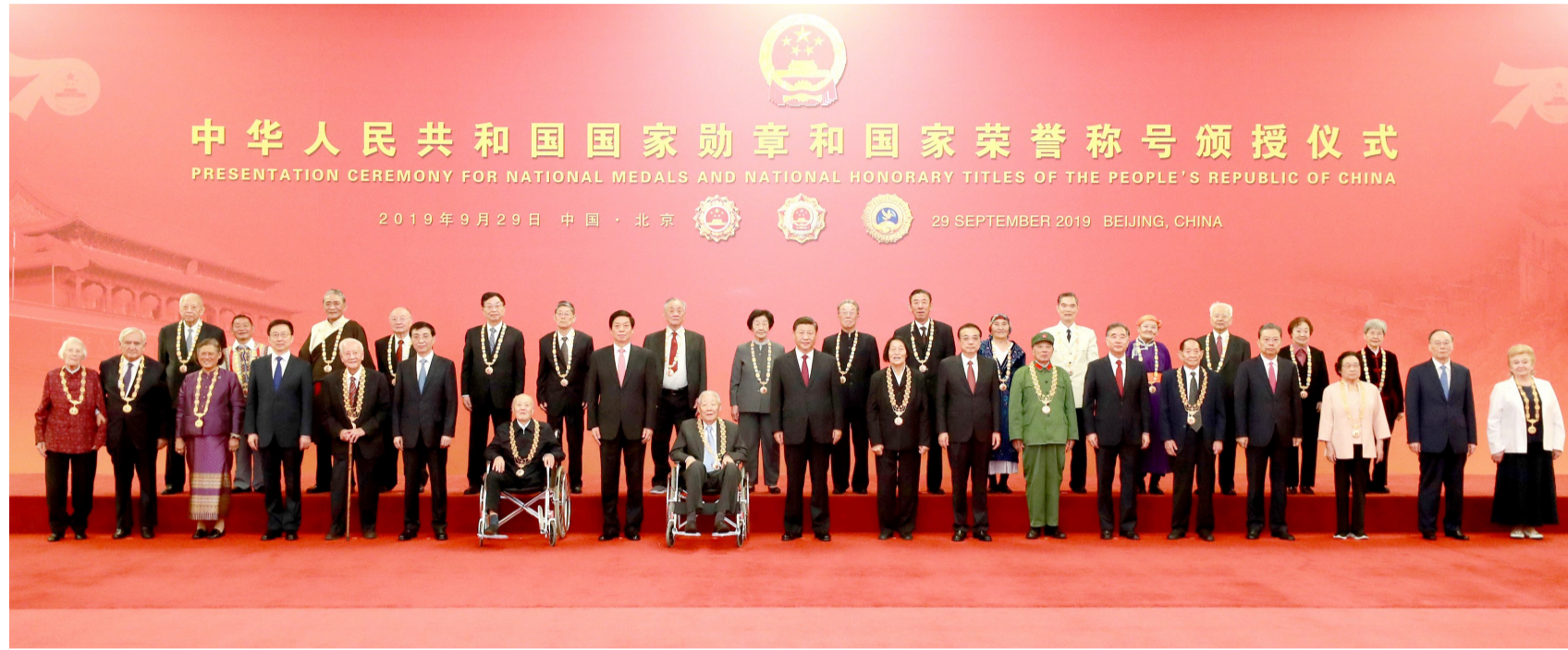
▲9月29日,中华人民共和国国家勋章和国家荣誉称号颁授仪式在北京人民大会堂金色大厅隆重举行。习近平等党和国家领导人同国家勋章和国家荣誉称号获得者合影

中华人民共和国国家勋章和国家荣誉称号颁授仪式29日上午在北京人民大会堂金色大厅隆重举行。中共中央总书记、国家主席、中央军委主席习近平向国家勋章和国家荣誉称号获得者颁授勋章奖章并发表重要讲话。习近平强调,崇尚英雄才会产生英雄,争做英雄才能英雄辈出。英雄模范们用行动再次证明,伟大出自平凡,平凡造就伟大。只要有坚定的理想信念、不懈的奋斗精神,脚踏实地地把每件平凡的事做好,一切平凡的人都可以获得不平凡的人生,一切平凡的工作都可以创造不平凡的成就。