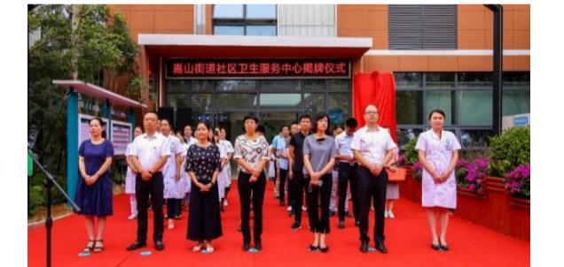
▲揭牌仪式现场

9月26日上午,嵩山街道社区卫生服务中心举行新址揭牌仪式。嵩山街道社区卫生服务中心是一所集医疗预防、保健、健康教育、计划生育技术指导等“六位一体”非营利性的社区卫生服务机构,湖南省中附院医院医联体合作、重点扶持单位。