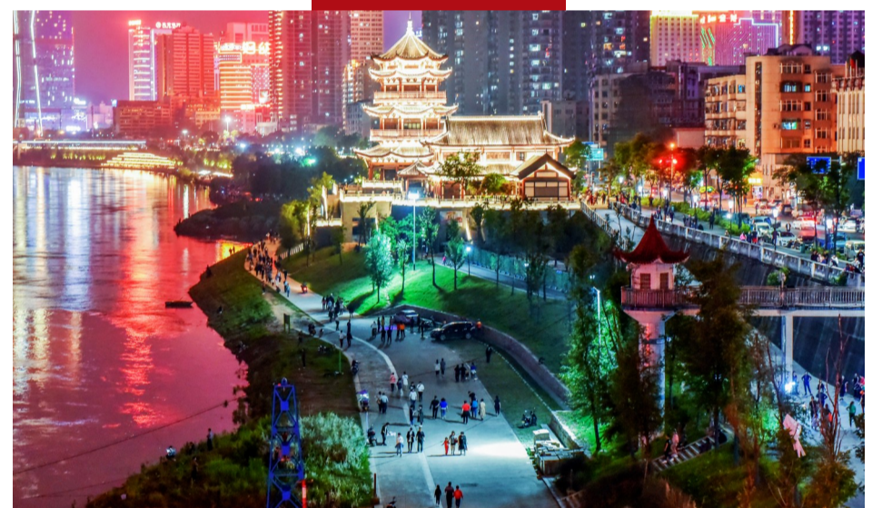
▲湘江两岸灯火辉煌,人流如织