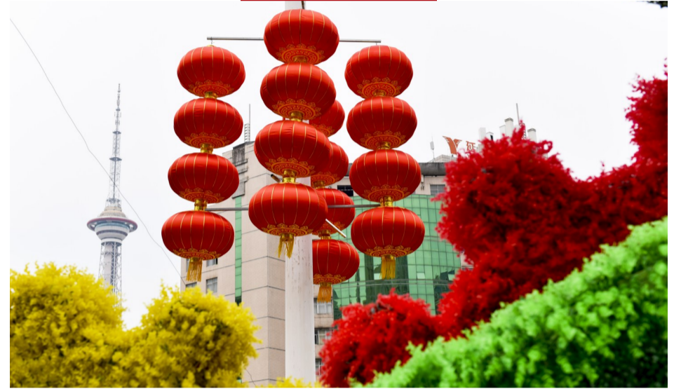
▲河西街头,在红、绿、黄孔雀映衬下的大红灯笼

习近平总书记说,幸福和美好生活都是奋斗出来的。过去70年,我们历经风雨沧桑取得了辉煌硕果;放眼未来,我们砥砺前行必将开创新纪元。