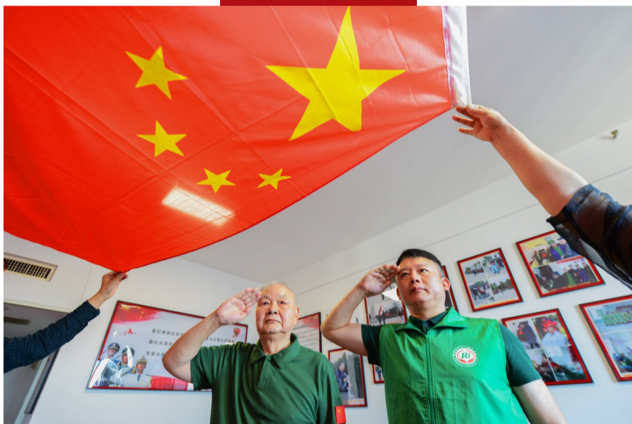
▲80岁高龄的老兵官自愿和市荣誉社工服务中心的志愿者一起向国旗敬礼