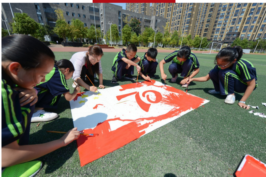
▲天元中学1908班的师生们在为班级手绘红旗