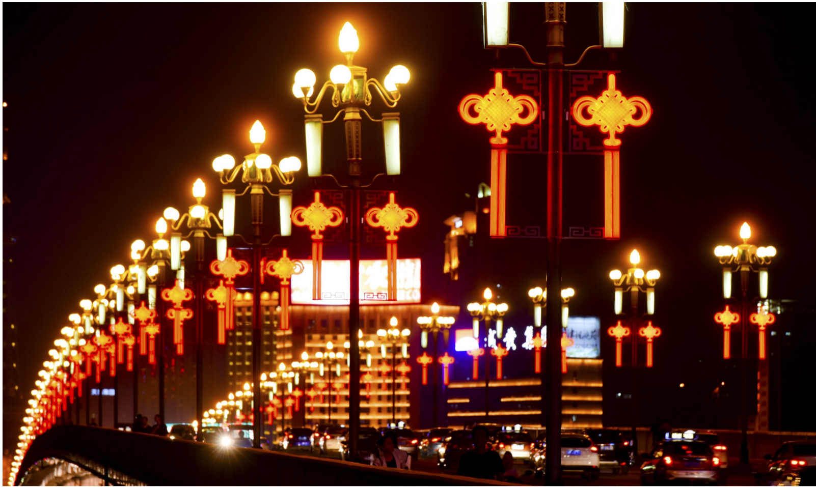
▲株洲大桥上,发着红光的中国结与灯光交相辉映