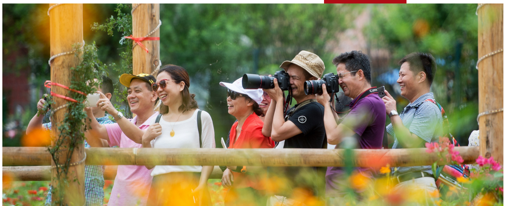
▲来三门镇响水村游玩观光的市民,面对美景,频频按下快门