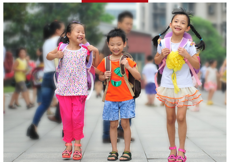
▲出外踏青游玩的小学生,五颜六色的着装犹如童模