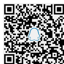
▲晚报乐活周刊QQ读者群