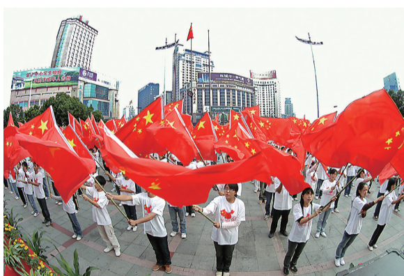
2009年,第一届“我为祖国献热血”启动。