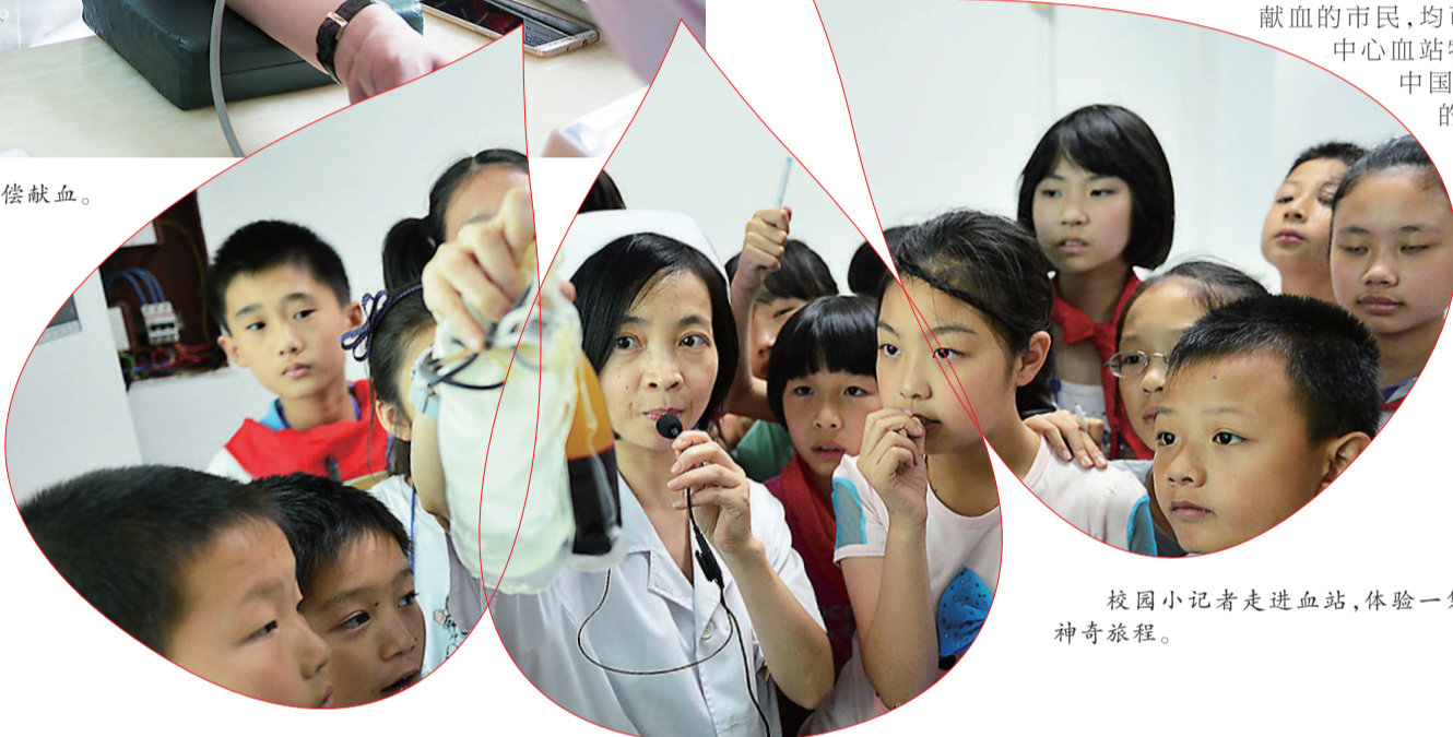
校园小记者走进血站,体验一袋血的神奇旅程。

9月24日,市中心血站通过官方微博、官方微信发布了举办“见证70年·热血礼赞中华”活动消息,目前已接到近千名志愿者线上、线下的报名。今年十一是新中国的70周年生日,也是我市举办“我为祖国献热血”活动十周年。十一国庆这天,全市13个献血点期待市民踊跃参加无偿献血。