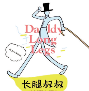
《长腿叔叔》简·韦伯斯特 著