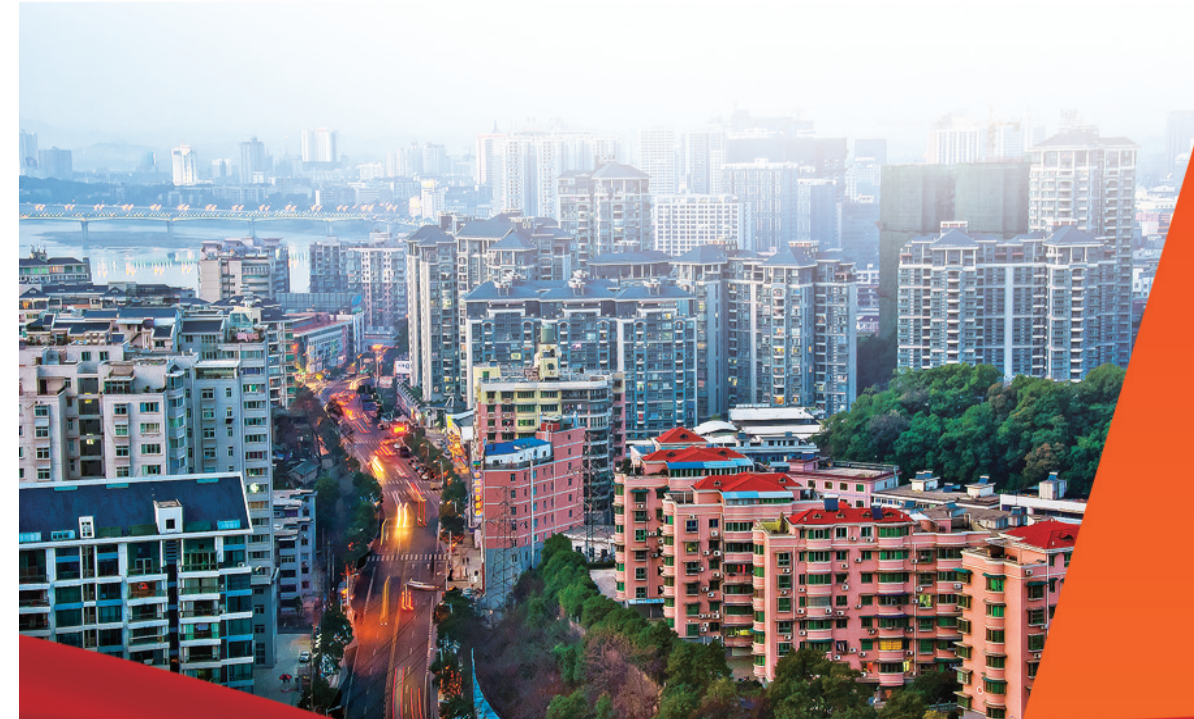
欣欣向荣的芦淞区。