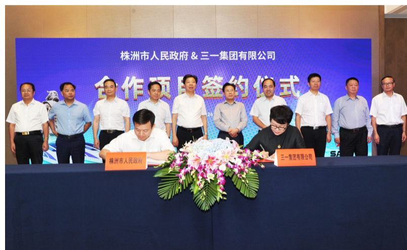
▲签约现场

昨日上午,市人民政府与三一集团举行签约仪式,三一集团的智慧钢铁产业城、石油智能装备与区域研发中心(总部基地)、工程机械二手交易市场三个项目正式落户株洲。三一集团董事长梁稳根,市委书记、市人