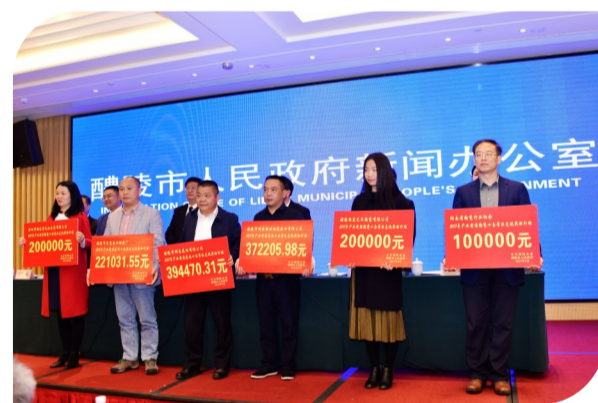
产业突围“四个十条”政策奖补兑现