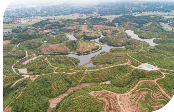
万亩油茶基地。