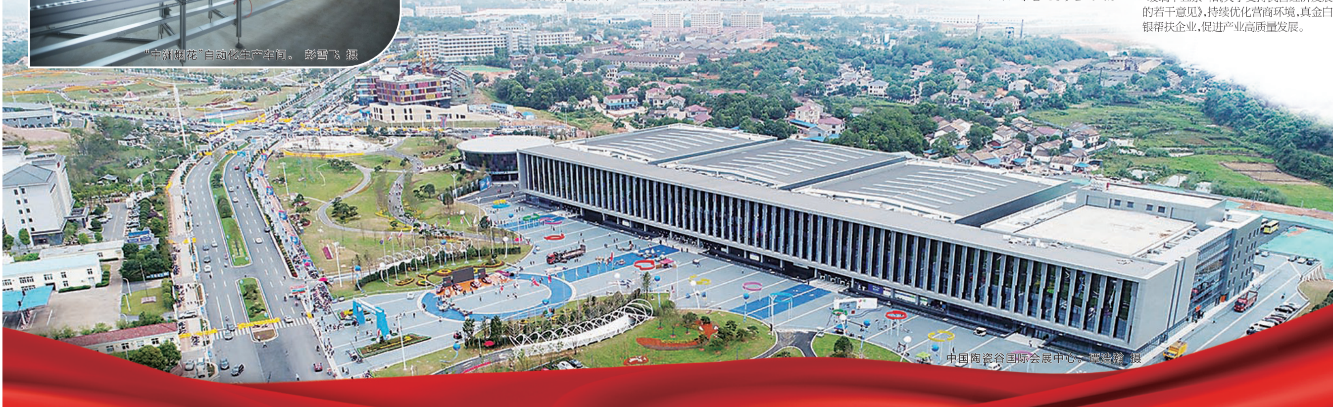
中国陶瓷谷国际会展中心。