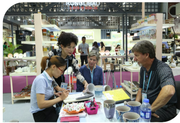
广交会上,欧美客户与醴陵陶瓷企业洽谈

2017年初,该市出台产业突围“四个十条”政策,通过设立产业发展基金,制定优惠奖励措施,扶持产业发展。今年,该市按照“企业向园区集中,要素向产业集中,干部向服务集中”的新思路,对“四个十条”政策进行再次修订和完善,同时出台“玻璃十五条”和《关于支持民营经济高质量发展的若干意见》,持续优化营商环境,真金白银帮扶企业,促进产业高质量发展。