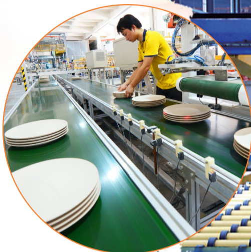
全省首条陶瓷等静压自动化生产线。