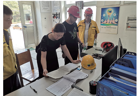
燃气专项检查现场。

检查过程中, 对各个站点存在的问题, 会根据《城镇燃气管理条例》《湖南省燃气管理条例》和现场检查记录表, 要求其立即整改, 定期维护检修设备, 及时更换老化、磨损的设备, 尽快完成整改工作, 保持站场环境卫生整洁, 加强加气车辆司乘人员的