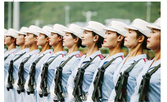
▲图为阅兵训练现场

在阅兵训练场,由北京市朝阳区在编女民兵遴选抽组的方队中,81名“妈妈队员”格外引人注目。