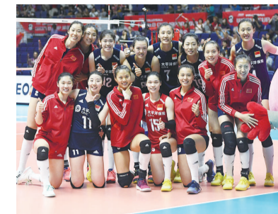
军发起最后的冲击。中国队最后的三个对手是荷兰队、塞尔维亚队和阿根廷队。

本场比赛是中国队在札幌的最后场比赛,休战两天之后,女排姑娘们将于27日起在大阪向世界冠军