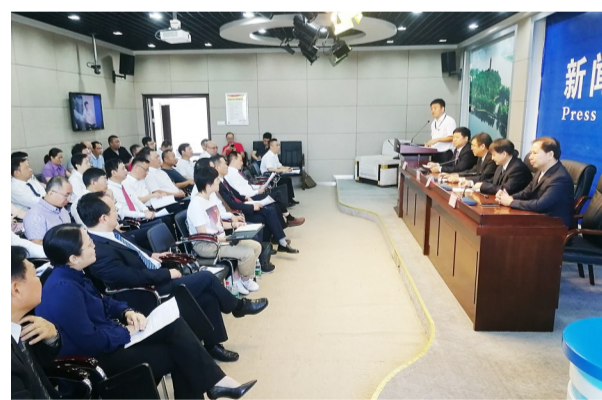
▲学员现场模拟新闻发布会进行应对媒体实践教学

本报讯(记者 肖捷)9月24日上午,我市2019年第三期“县处级干部进修班”在市委党校开展媒体沟通情景模拟教学活动。