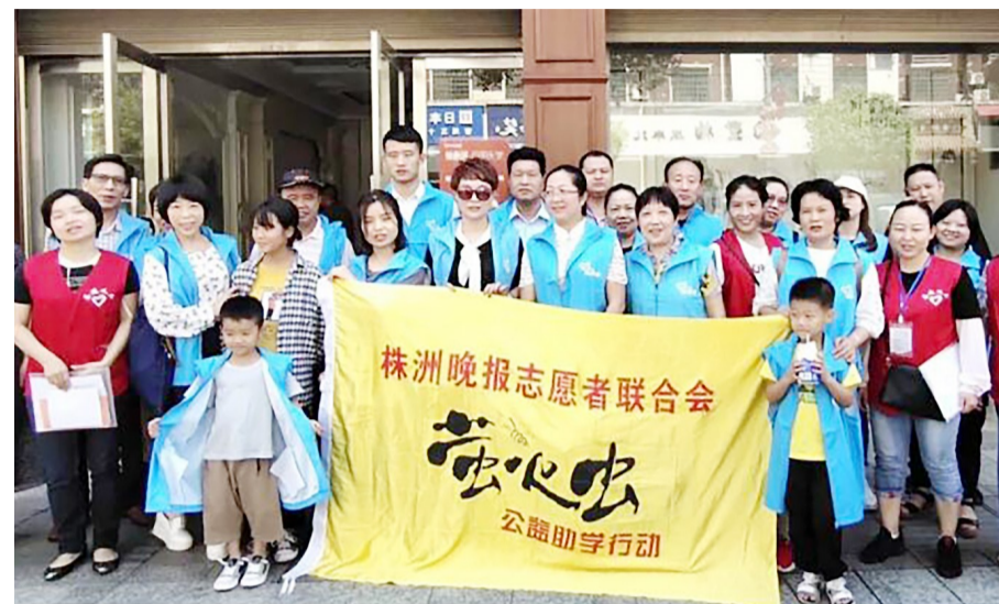
▲“萤火虫公益助学”的爱心人士和志愿者为茶陵贫困生送助学款