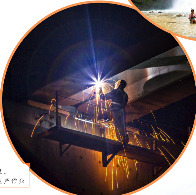
企业车间里，工人正在生产作业

发展生态农业产业，不仅守住了绿色，还让群众吃上了健康食品，找到一条生态保护与经济发展的双赢之路。