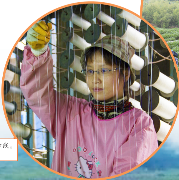
企业工人正在纺线。

目前，该县乡村旅游接待点已达135个，农家乐412家，带动5600余人实现“绿色就业”。