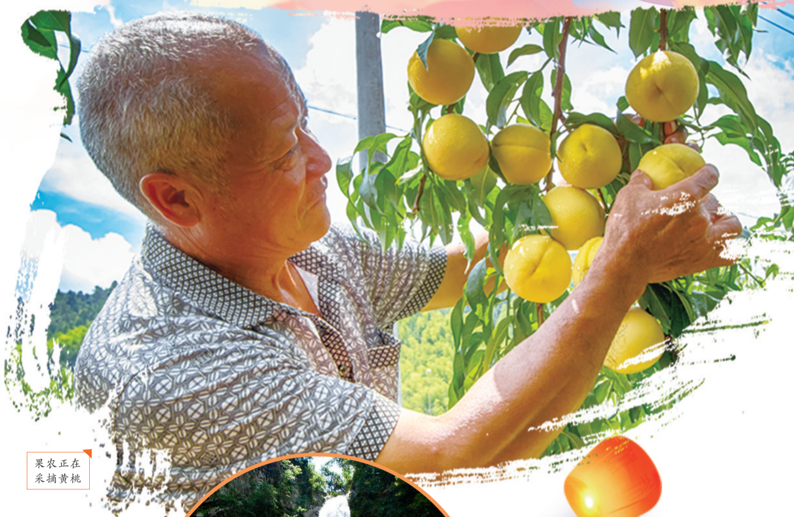
果农正在采摘黄桃

2019年9月24日 星期二 电话:22527656 责任编辑:尹二荣 美术编辑:刘 斌 校对:谭爱芳