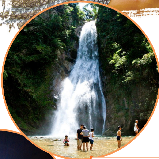
夏日，珠帘瀑布为游客送清凉。

近年来，该县相继获评“全国最美生态旅游示范县”“全国十佳生态休闲旅游城市”等荣誉称号。2018年，炎陵县接待游客687.1万人次，实现旅游总收入53.2亿元。