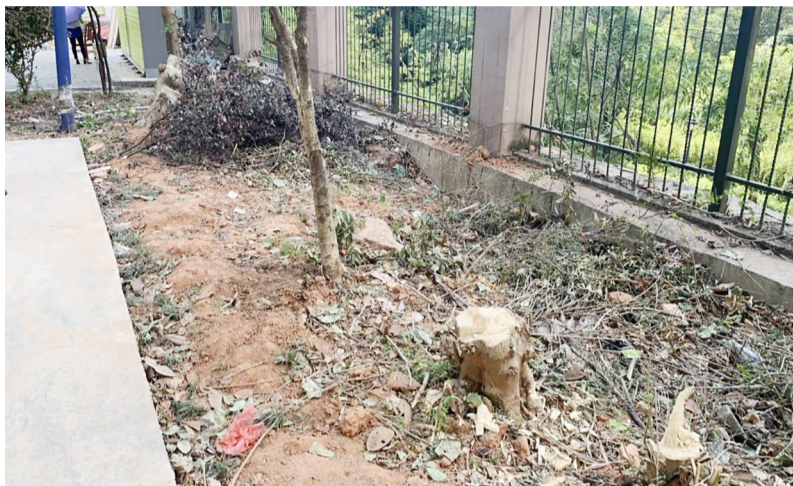
▲小区公共区域部分树木被砍伐

□《铲掉绿化,增加停车位 又有小区因为这事闹起了矛盾》后续 “天泉一品”,还是有树被砍了