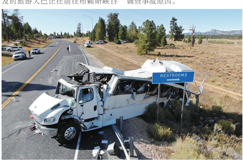
美国犹他州布赖斯峡谷国家公园附近的车祸现场。

犹他州高速公路巡警表示,事发时旅游大巴正在前往布赖斯峡谷国家公园的路上,车上共载有30人。车祸造成至少4人死亡,12人至15人重伤,10人伤势较轻。伤者被陆续送往犹他州南部的多家医院。