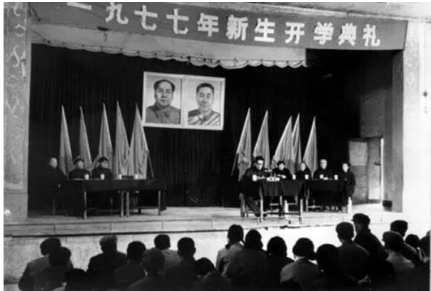
▲高考恢复后的入学典礼