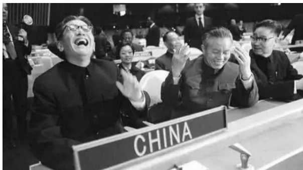
▲中国恢复联合国合法席位