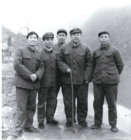
李俭珠将军(右二)作者(左一)