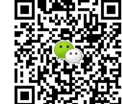
扫一扫二维码,添加微信