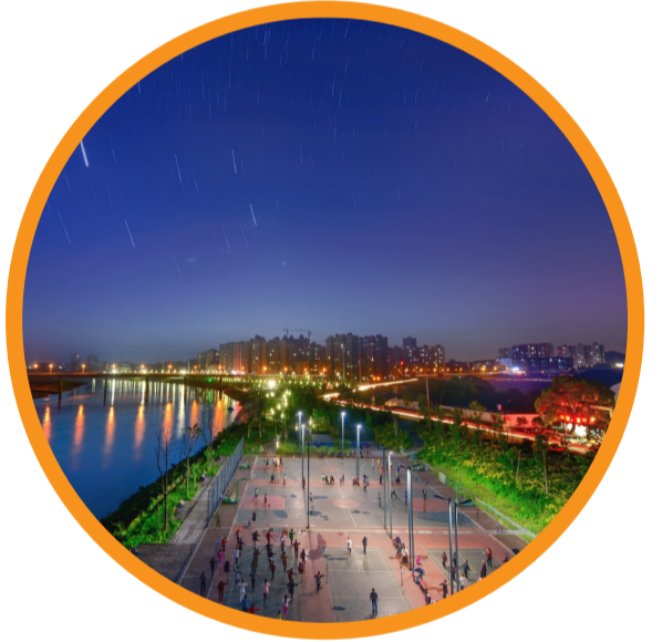
湘江风光带成为群众休闲的好去处