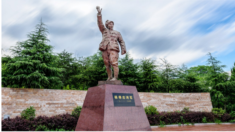
红色旅游景点杨得志故居