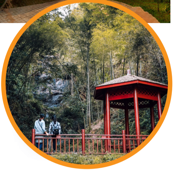
南塘村发展乡村旅游