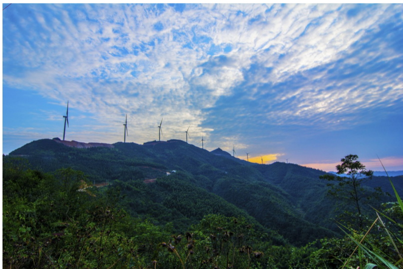
长株潭地区最大的风力发电场——绿口区凤凰山风电场