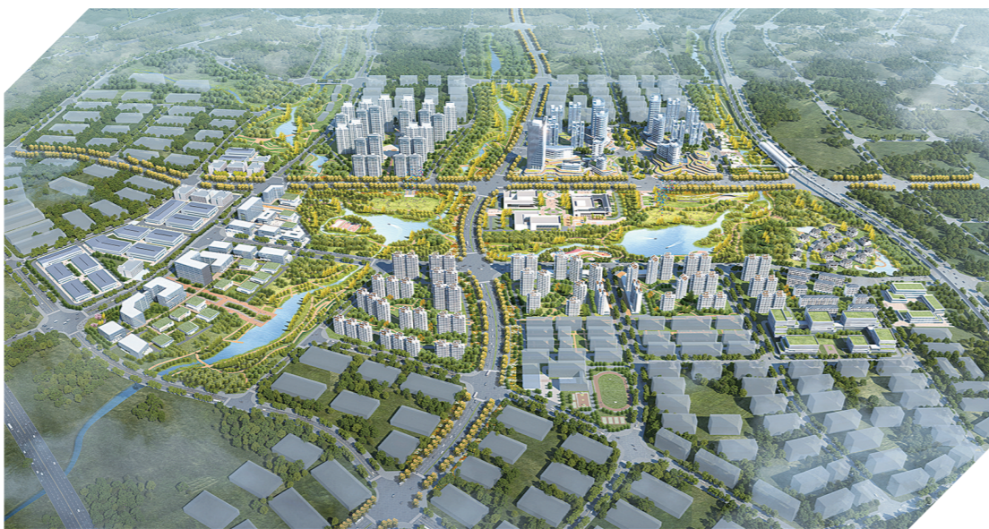
▲华夏幸福云龙产业新城效果图