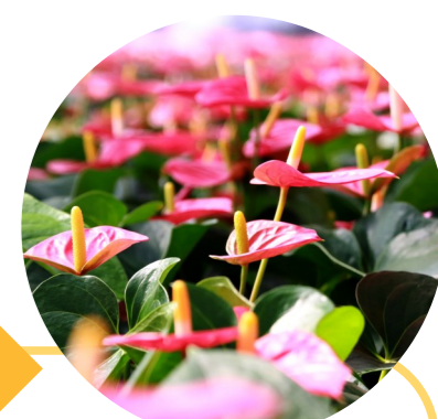
云田花木红胜火。何勇摄