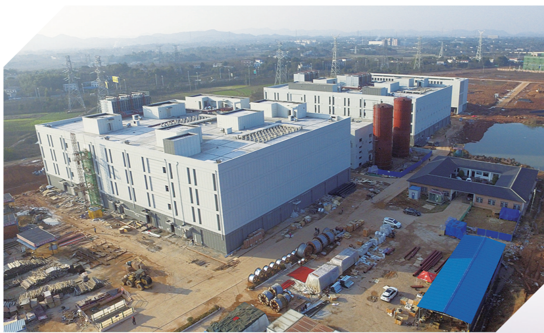
▲即将投入运营的湖南(株洲)数据中心