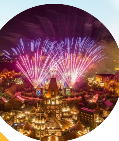
方特夜景。