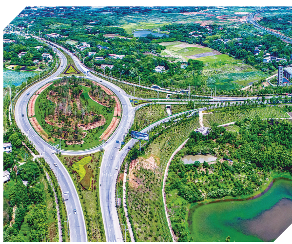
▲正在快速化改造的云龙大道。

7月31日,湖南省农村工作领导小组办公室、湖南省农业农村厅举行新闻发布会,发布了湖南省首批十个特色农业小镇名单,凭借独特的区位优势 and 兴趣的花木产业,云龙示范区云田镇成功入选“花木小镇”。