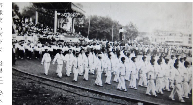
上世纪80年代市体育馆举行大型比赛时的盛况。

近年来，株洲市体育中心管理处发展为株洲市全民健身服务中心，包括一场两馆、河东体育馆等。依托这些设施，我市倾力打造惠民实事工