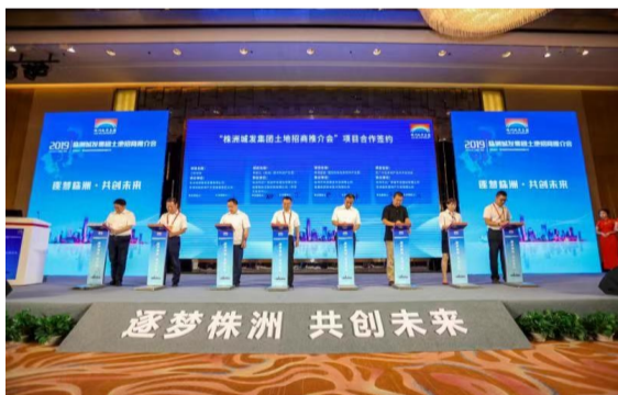
土地招商推介会现场。

现场举行了隆重的集中签约仪式，一个创新创业产业园项目将落户南洲片区；一个科创产业园、一家由湘雅三医院领衔的医联体医院、一家商业综合体将落户武广片区；一个智能科技示范园项目和智慧园区大数据云项目将进驻清水塘片区；一所枫溪学校和一所国际科技信息软件产业园将落户枫溪片区。