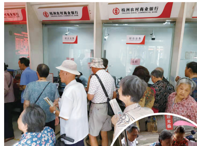
▲昨日,芦淞区一家农商银行,老人排队办理高龄补贴银行卡