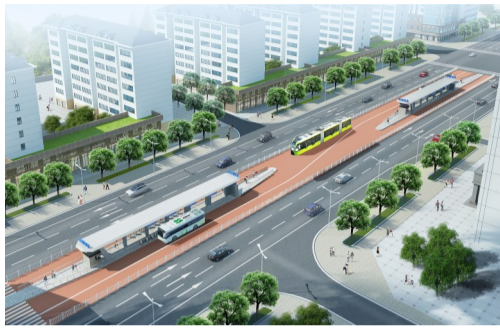
▲快速公交走廊站点效果图

本报讯(记者 戴凇 通讯员 殷滋 郭力嘉)昨日,记者从市交通运输局获悉,为保障我市公交都市创建成功,促进我市智能产业发展,提升公交车辆和社会车辆在高峰期的整体运营速度,我市将启动株洲市智能轨道交通系统项目建设,在全市范围构建“一环两横一纵”的快速公交廊道,配套智能红绿灯、相关站场等设施。