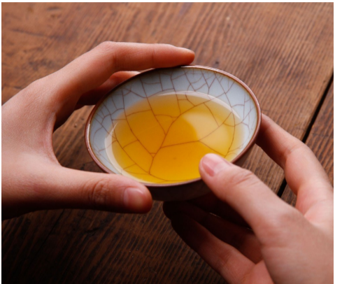
▲客来敬茶是传统礼节(资料图)