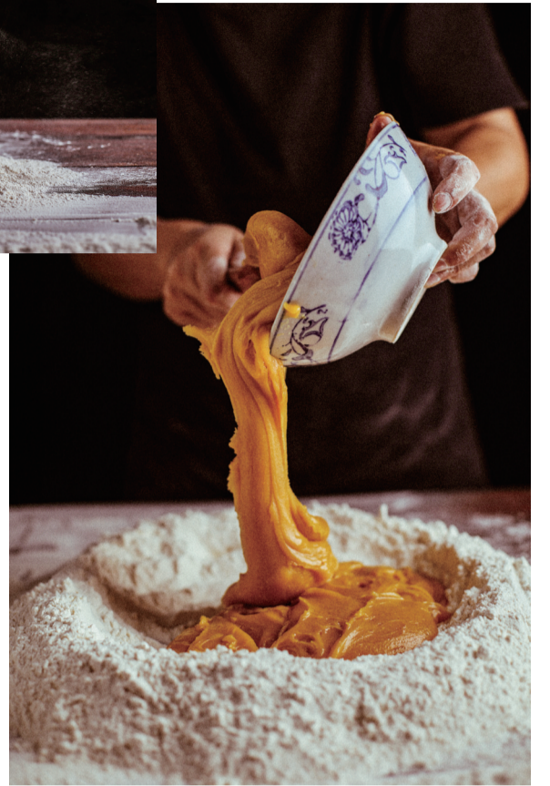
▲油和糖浆混合搅拌,倒入预拌粉。