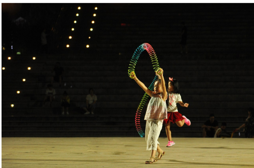
小朋友在钢琴广场玩耍。