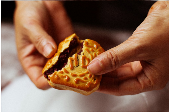
▲烘烤之后,香气扑鼻。