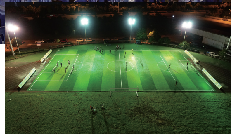
市民在体育中心踢足球。

在我市各大体育中心,丰富多彩的特色体育活动让群众乐在其,为他们开启了一方新天地。