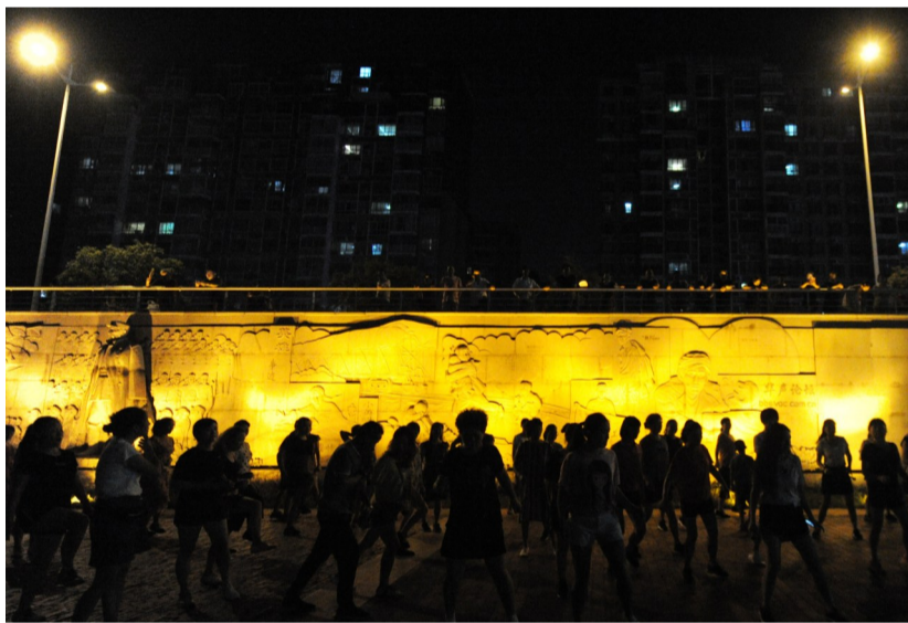
市民在风光带跳广场舞。