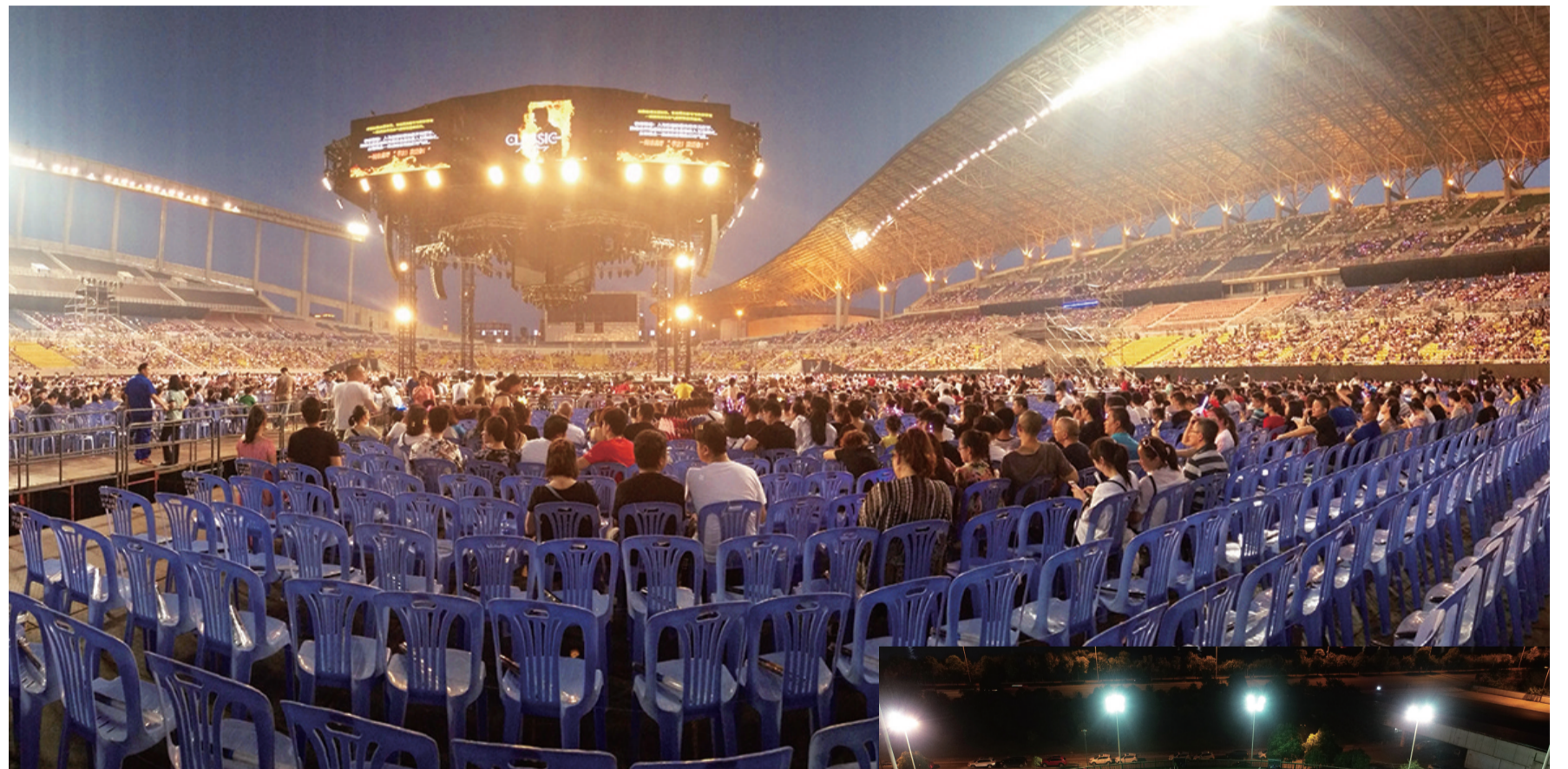
市民在体育中心观看演唱会。