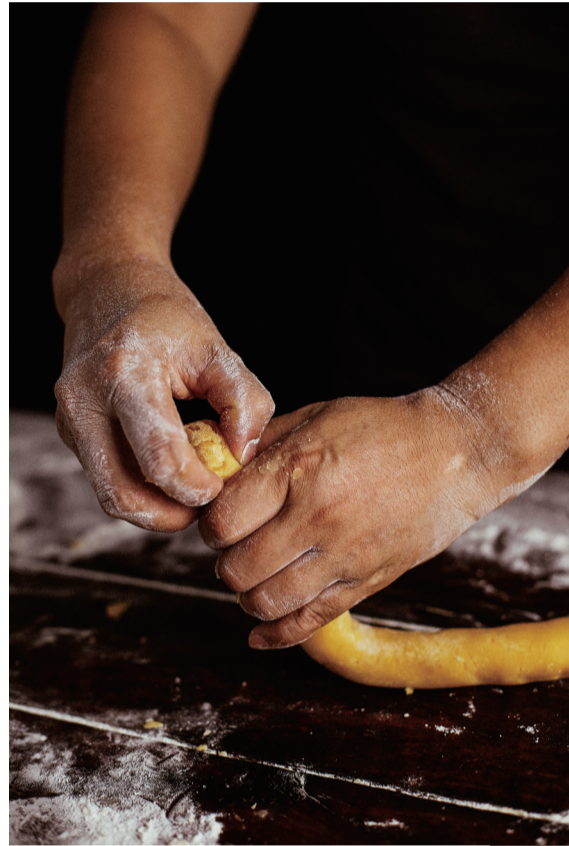
▲将面皮分成约30克一份,包入内馅。