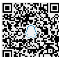
▲晚报乐活周刊QQ读者群

特别提醒:本刊登载的文章、美术作品均有稿酬(纸版、电子版、微信版稿酬合一),凡未收到稿酬的作者,请与本刊编辑部联系。作者如无特殊声明,即视为同意授予本刊及本刊微信版、本刊合作网站信息网络传播权,本刊支付的稿酬包括此项授权的收入。