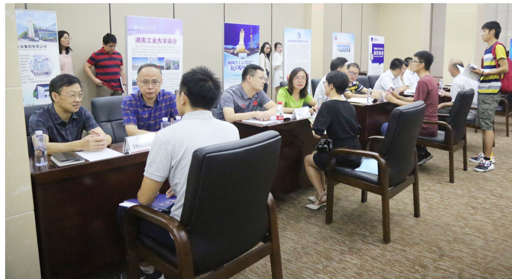
▲洽谈会上,参会的博士正在与各用人单位对接洽谈

本报讯(记者 杨凌凌 通讯员 李志伟 冯峰)9月7日,“2019年第六届海归论坛——走进中国动力谷·株洲专场活动”盛大开启。省政协副主席、致公党湖南省委主委胡旭晟,省侨联党组书记黄芳,市委书记、市人大常委会主任毛腾飞参加活动。