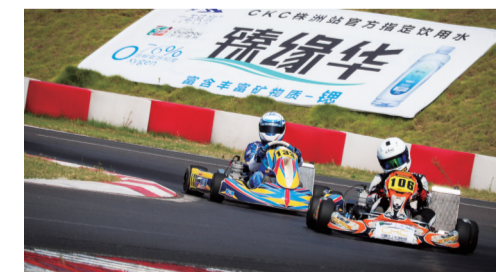
▲CKC株洲总决赛现场

车场。株洲国际卡丁车场符合国际汽车运动联合会(FIA)标准。这条赛道除拥有众多极具挑战性的弯道组合之外,还拥有同级别赛车场中非常罕见的起伏设计,充满挑战和乐趣的赛道设计受到广大车手的青睐和好评。数不清的体验活动,让这里成为一个汽车文化的集散地、赛车文化的起点。(王莉)