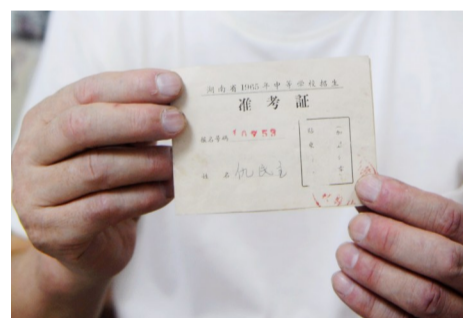
▲仇民主1965年报考株洲一中的准考证