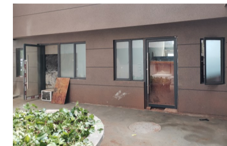
▲紫金华府临街门面开的后门

介绍,业主要求用砖将后门封住,但这达不到消防要求。经过商讨,开发商提出用栏杆将后门和小区内部隔离,这样外来人员平时就不能随意进出小区。在场的业主对于这种解决方案表示无法认可,认为这样还是不能防盗。