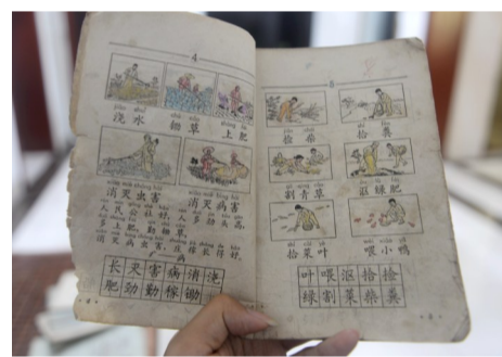
▲上世纪60年代的教科书多与农业有关