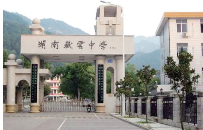
现在的岳云中学外观

1966年10月2日,何炳麟老先生病逝于长沙,享年90岁,在省会长沙开过隆重的追悼会后,骨灰移葬南岳半山亭。