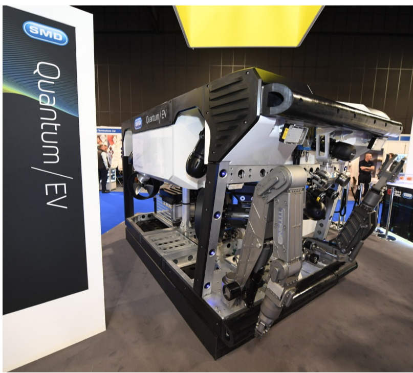
工作级电驱水下机器人。

强强联合，赋予了新产品强大的创新基因。SMD公司的遥控和自治技术（RAT）总监Mark Collins介绍，灵活的模块化设计是此次电驱ROV技术革新之一，该技术可满足传统船舶、无人船甚至其他固定平台等多种工况需