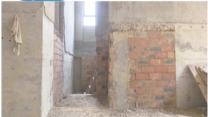
一楼地面被下挖1.5米。

据了解,今年前8个月,市县两级检察院共办理公益诉讼案件219件,同比增长37.7%。