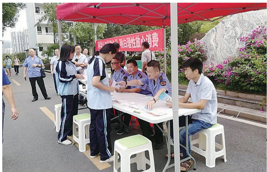
▲工作人员向学生开展保健食品宣传工作