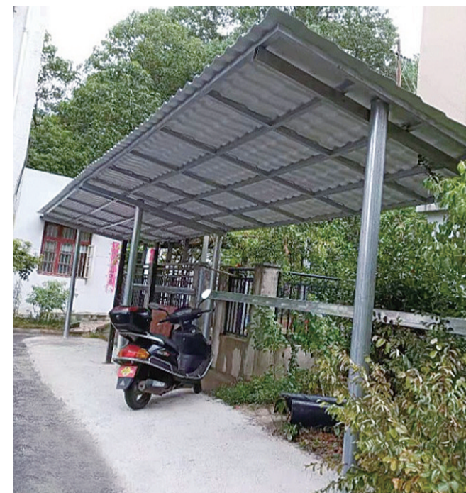
▲一栋前坪,电动车停在新修建的车棚里

本报讯(记者 李卉 通讯员 唐子珍)电动车乱停、飞线充电,火灾隐患让居民忧心忡忡。昨天,记者在石峰区优山美小区看到,该小区统一设计修建的停车充电棚已近完工,昔日这本“难念的经”终于念通了。