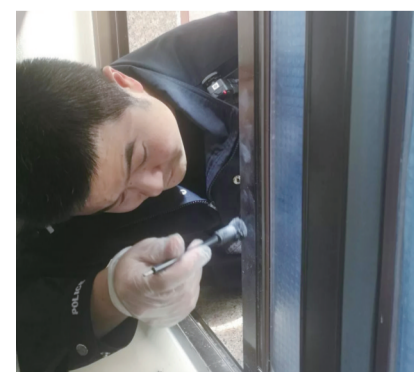
▲文明在案发现场进行勘察