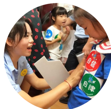
▲老师为学生贴上“寻宝勋章”

近日,荷塘外国语小学部的一年级新生和家长一起,度过了为期两天的新生入学体验活动。据悉,该体验活动是荷塘外国语学校为缓解新生和家长的入学焦虑心理特别打造的。同时,邀约家长一起参加也是为奠定良好的家校合作打下基础。