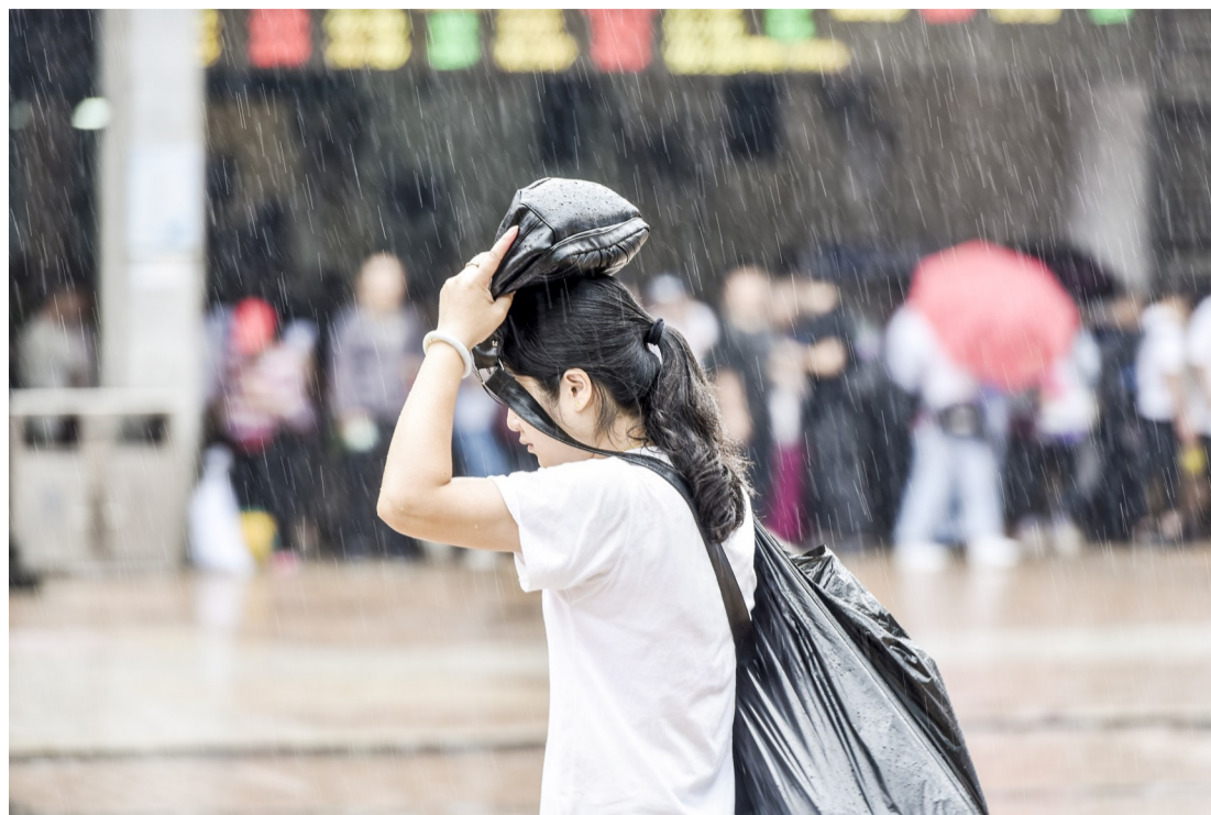
▲9月2日,株洲火车站,细细的雨丝浇透了旅客的衣物