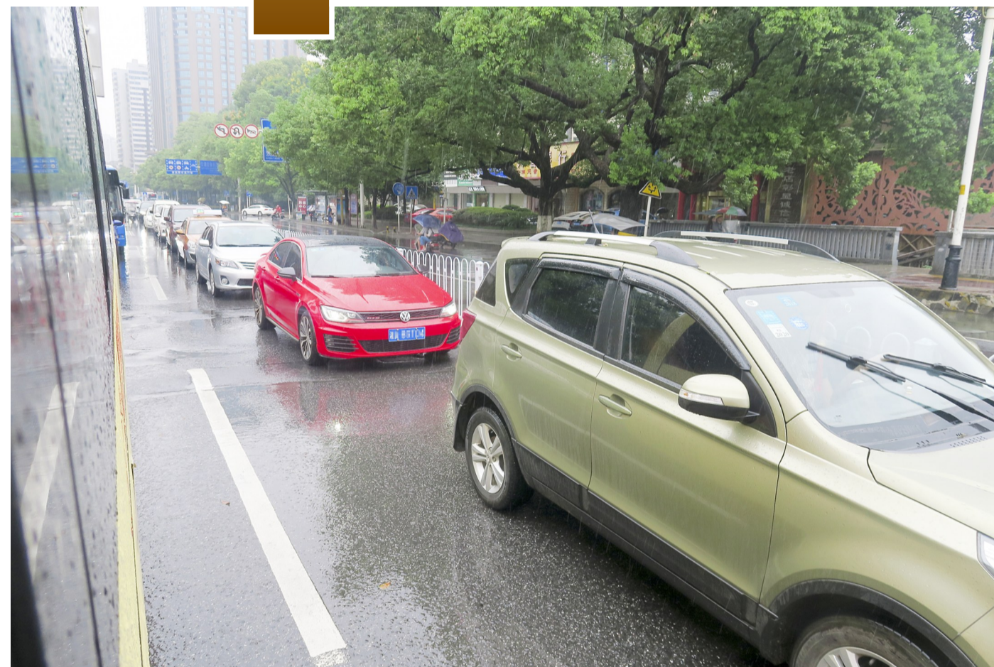
▲昨日是新学期开学第一天,加之降雨等原因,市区多处出现交通拥堵。图为新华路上车辆排队长