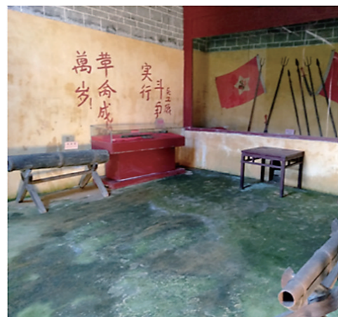
东冲兵工厂内的展品。