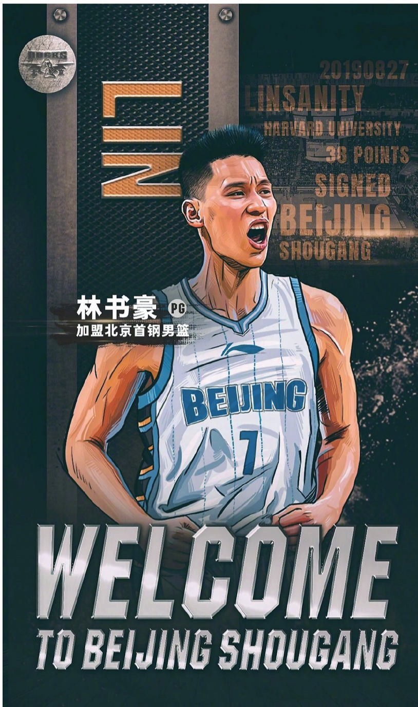
北京首钢男篮欢迎林书豪的海报

总而言之,“林疯狂”登陆CBA,为中国篮球带来了很大的想象空间,他的加盟将产生怎样的“蝴蝶效应”,值得期待。