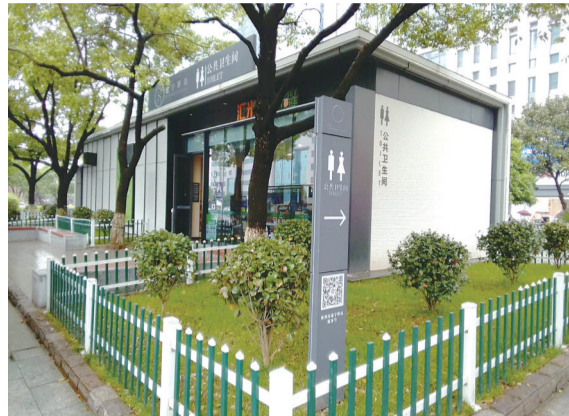
中心广场的建宁驿站

“天下大事，必作于细。”解决好服务群众“最后一公里”问题，需要从“微视角”出发，进行“微改革”，以“小”切口推动问题解决，以“小”变化优化服务、促进发展，切实增强群众的获得感和幸福感。