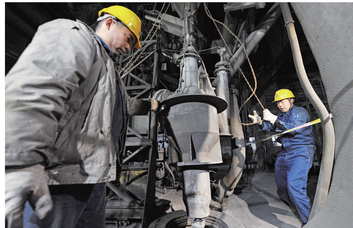
▲工作人员正在拔出基夫赛特炉的下料口喷嘴,此举意味着株冶在清水塘地区的最后一座冶炼炉熄火停产(资料图)

8月27日,围绕清水塘老工业区搬迁改造工作,“壮丽70年·奋斗新时代”庆祝新中国成立70周年系列新闻发布会进行第九场发布。