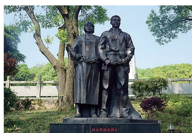
醴陵烈士陵园,陈觉和赵云霄的铜像傲然挺立。

“谁无父母,谁无儿女,谁无情人我们正是为了救助全中国人民的父母和妻儿,所以牺牲了自己的一切。我们虽然死了,但是我们的遗志自有未死的同志来完成。”“你的父母是共产党员,我们不能抚养你长大……希望你长大好好读书,且要知道你的父母是怎样死的。”在中国革命军事博物馆的一个展柜中,并排陈列着两封烈士的遗书。一封是丈夫写给妻子的遗书,一封是这位妻子写给自己刚出生不久的孩子的遗嘱。遗书的主人是一对年轻伉俪,即著名的革命烈士陈觉与赵云霄。1928年,两人因叛徒出卖而牺牲。英雄虽已逝去,但精神永存人间。用手机微信“扫一扫”功能扫码观看视频。