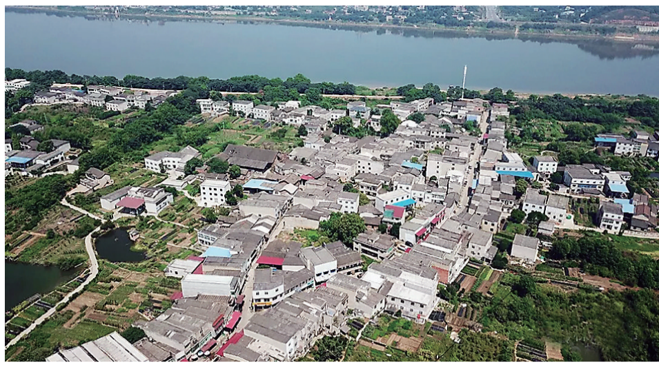
航拍马家河老街。

媒体融合,移动优先。欢迎来到“看吧视频”专区。在这里,我们用视频推介株洲转型发展亮点,扫描当下时政社会热点,服务市民生活难点。我们期待,所有读者,一同参与,或提供成品,或共同拍摄制作。题材不限,有趣的、有用的、工作的、生活的,均可。联系电话:28823909;视频投稿邮箱:668748@qq.com(可发视频,也可只附上网链接地址),一经采用,稿酬从优。